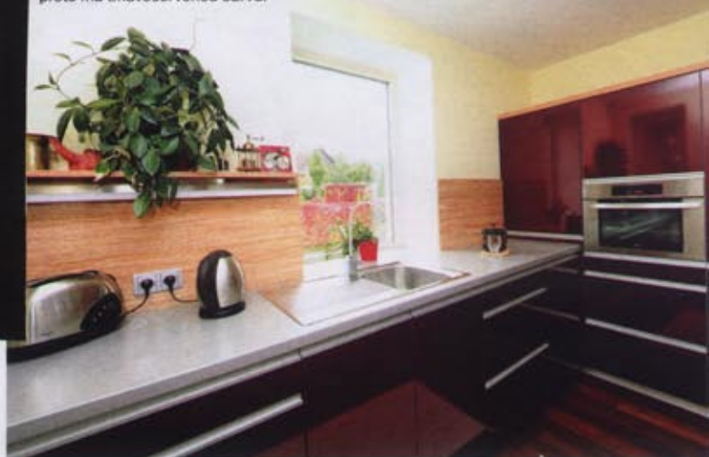
„Kuchyň mám v oblasti ohně na jihu, proto má tmavočervenou barvu.“