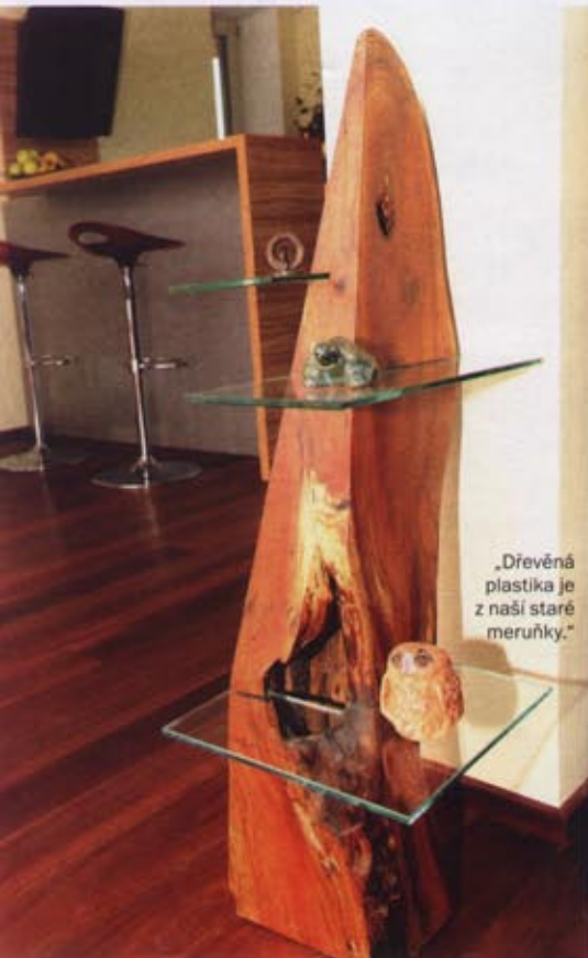
„Dřevěná plastika je z naší staré meruňky.“

mě, abych ho dokončila... Začala jsem rituální očistou. Negativní minulost lze samozřejmě změnit.