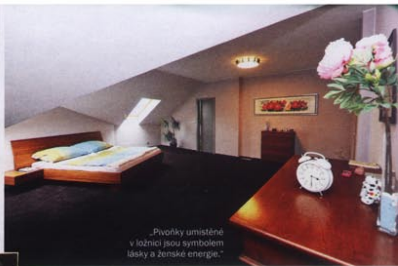
„Pivoňky umístěné v ložnici jsou symbolem lásky a ženské energie.“