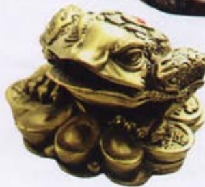
„Třínohá žába s mincí v tlamičce chrání před neštěstím a nebezpečím, podporuje hojnost.“