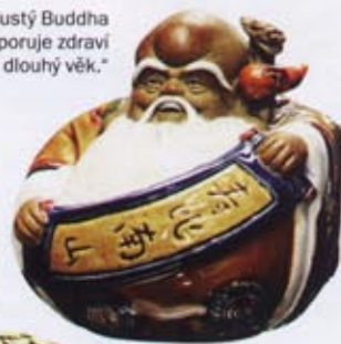
„Tučný Buddha podporuje zdraví a dlouhý věk.“

Použila jsem vědeckou statistiku a pak jsem si uvědomila, že deset procent dne je asi dvě a půl hodiny. Znáte někoho, kdo tráví tolik času venku? Snad matky s malými dětmi a majitelé psů. Ve skutečnosti jsme na tom mnohem hůř. Do interiérů je třeba dostat živé rostliny, akvária, fontány... A poslední dobou