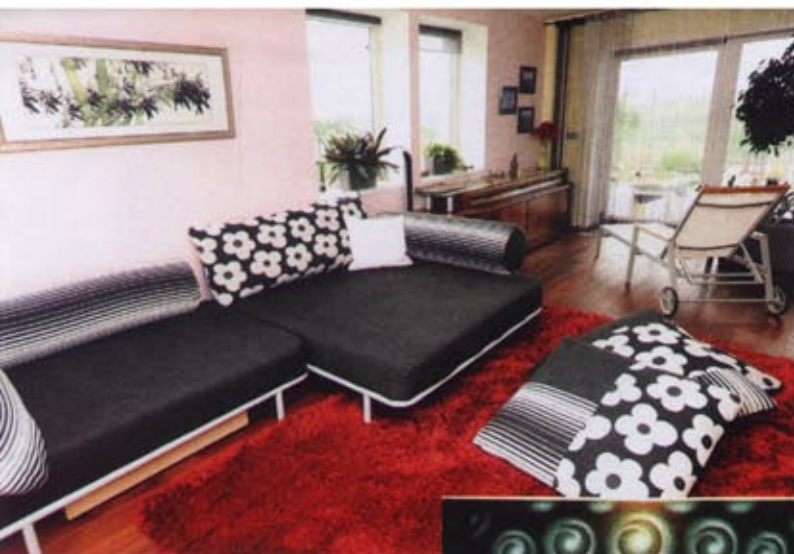
Feng shui je trochu hrou se symboly. „Koberec v obývacím pokoji v barvě ohně posiluje energii. Bambus na stěně je zase zdrojem zdraví a vitality.“