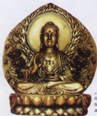
„Buddha Ru Lai je ochránce zdraví, spokojenosti a osobního klidu.“