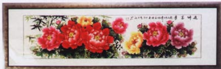
„Obraz Pivoňky je ruční tušová malba a opět symbolizuje jaro, lásku a ženskou energii.“