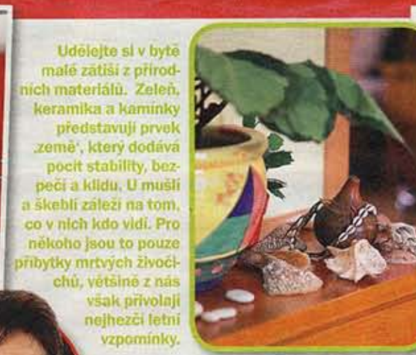
Udělejte si v bytě malé zátisi z přírodních materiálů. Zelen, keramika a kaminky představují prvek „země“, který dodává pocit stability, bezpečí a klidu. U muší a škeblí záleží na tom, co v nich kdo vidí. Pro někoho jsou to pouze přibytky mrtvých živočichů, většinu z nás však přivolají nejhezčí letní vzpomínky.

„U měni Feng Shui je velice obsáhlé a jeho studium je celoživotní,“ říká odbornice. To znamená, že se nikdo nestane mistrem ze dne na den. Inspiraci (doplňky do bytu, zařizování interiéru) najdete kupř. na www.fengshui-interiery.cz , tel. 775 897 852. Na