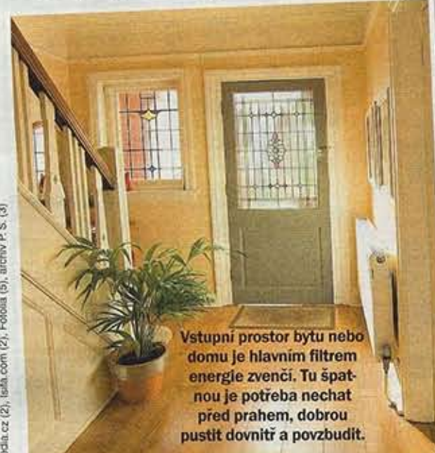
Vstupní prostor bytu nebo domu je hlavním filtrem energie zvencí. Tu špatnou je potřeba nechat před prahem, dobrou pustit dovnitř a povzbudit.

Jste pořád unavení, nic vás netěší? Rozhlédněte se po svém obydlí. Podle učení Feng Shui je to vaše zrcadlo! Zkuste udělat pár pozitivních změn, abyste se vy i rodina cítili lépe.