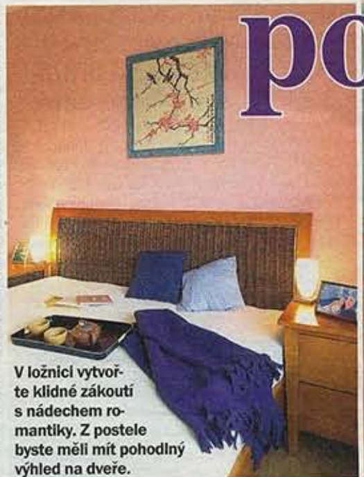
V ložnici vytvořte klidné zákoutí s nádechem romantiky. Z postele byste měli mít pohodlný výhled na dveře.